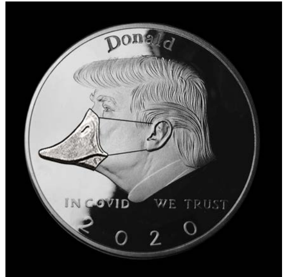
Victoria, Donald Trump

Ces deniers où ils s'affichent, encrassés au fil du temps et des tractations, sont en passe de devenir des pièces de musée. Là où elle était preuve de richesse et de puissance, la monnaie concrète, tactile, est-elle devenue has been ? Un sujet de choix pour les historiens, les collectionneurs... et les artistes.