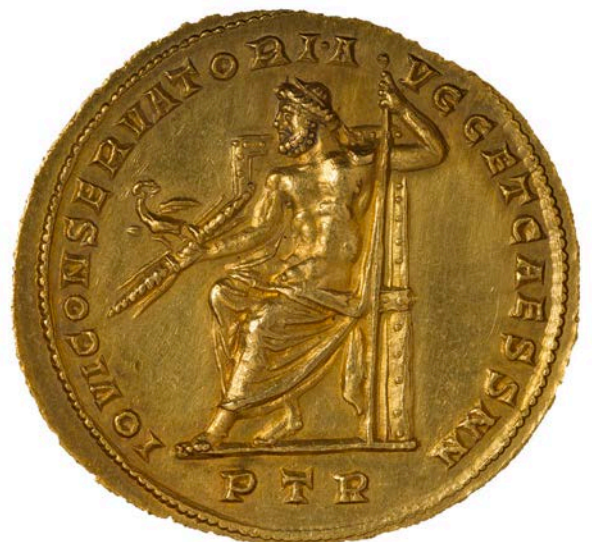
Dioclétien : multiple de 10 aurei, collection Banque de France, © Citéco