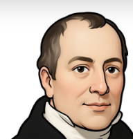
DAVID RICARDO (1772-1823)

→ Tout le monde bénéficie du commerce international.