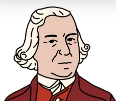
ADAM SMITH (1723-1790)

→ Les pays sans avantage absolu sont exclus du jeu, limite majeure de cette théorie.